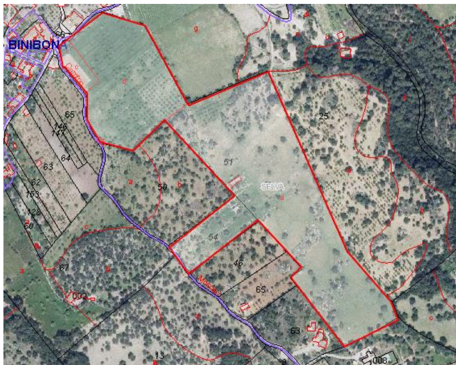
Imagen 1. Vista aérea de la finca en la que se sitúa la granja escuela

Situado Binibona, una pequeña aldea de Selva, un pueblo de Mallorca, la granja escuela se rodea completamente de naturaleza. Se trata de una zona rural situada a los pies de la Serra de Tramuntana. Es un sitio perfecto para situar la granja escuela debido a que permite completar uno de sus objetivos principales que es el de acercar a los visitantes al medio rural. Además, se trata de una ubicación cercana a la ciudad de Inca y rodeada de pueblecitos, lo que permite estar cerca de su público objetivo. Lugar idóneo para mantener animales y huerto, y para el desarrollo de actividades como el senderismo, orientación, tiro con arco, yoga y los distintos talleres que se llevarán a cabo.